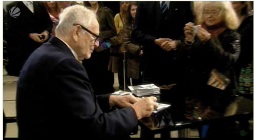
SAT.1 MORGENMAGAZIN, NOVEMBER 7, 2008