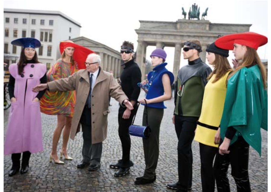
PHOTOCALL | BRANDENBURGER TOR | NOVEMBER 6, 2008