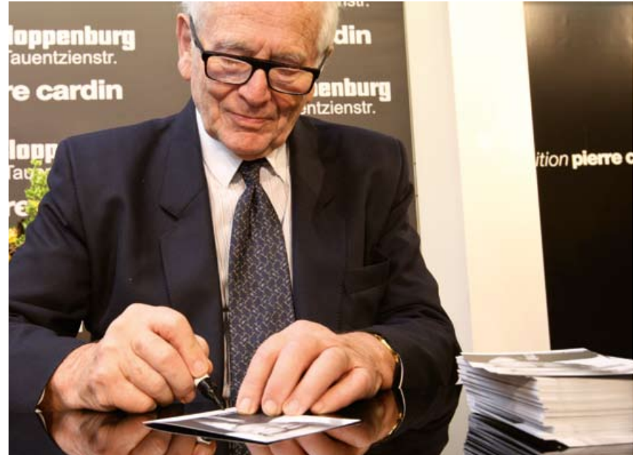
SIGNATURE SESSION | NOVEMBER 6, 2008