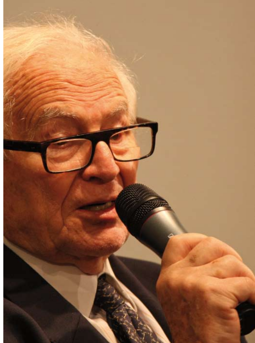
INTERVIEW WITH NADINE KRÜGER (SAT.1) | NOVEMBER 6, 2008